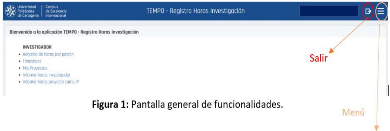
Figura 1: Pantalla general de funcionalidades.